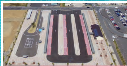
木更津金田バスターミナル