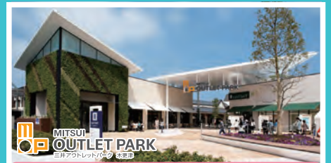
三井アウトレットパーク木更津