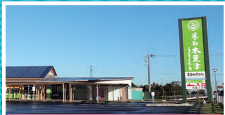
道の駅木更津 うまくたの里